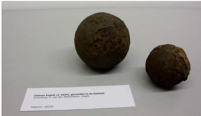
Kanonskogels uit het begin van de zeventiende eeuw (Vughts Museum).