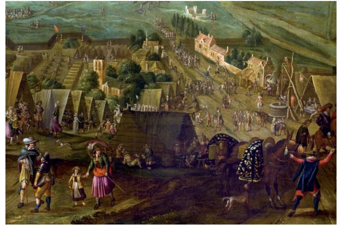
De legerplaats in Vught. 1629. In het midden de St.-Lambertuskerk; rechts: de Taalstraat met rechtsboven de ruïne van het Kartuizerklooster; en links: de tenten met winkels, bordelen en herbergen (Pauwels van Hillegaert; Van Lanschot Bank, 's-Hertogenbosch).