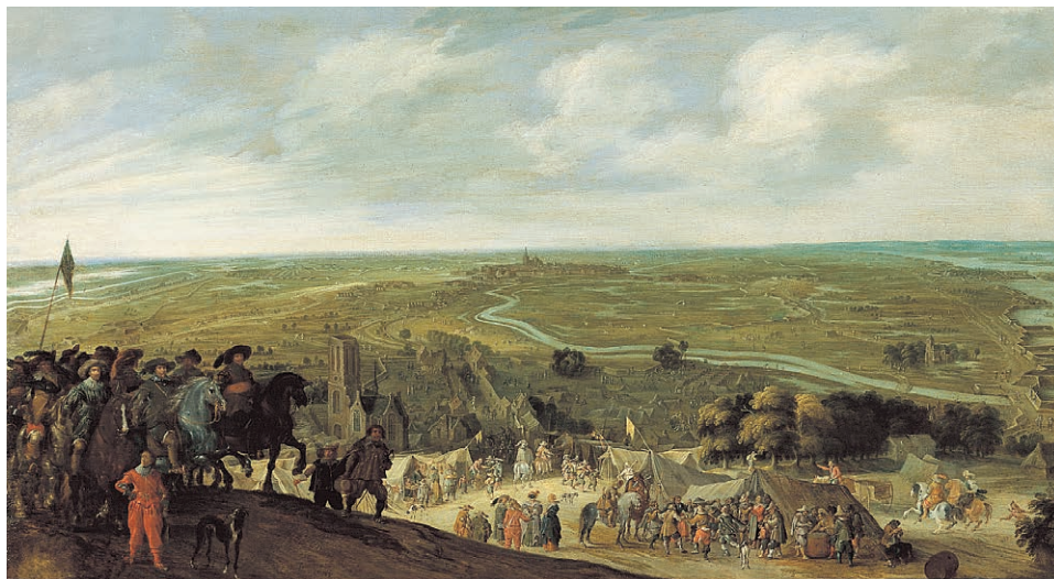
Het beleg van 's-Hertogenbosch, geschilderd door Pauwels van Hillegaert (Paleis Het Loo, Apeldoorn). Op de voorgrond het legerkamp van Frederik Hendrik in Vught met v.l.n.r. de St.-Lambertuskerk, de Taalstraat, twee bosjes aan de Dommel met de kasteeltjes Spreeuwenburg en Kouwenberg, en in het bos rechts kasteel Maurick. Aan de overkant van de Dommel ligt rechts Oud-Herlaer.