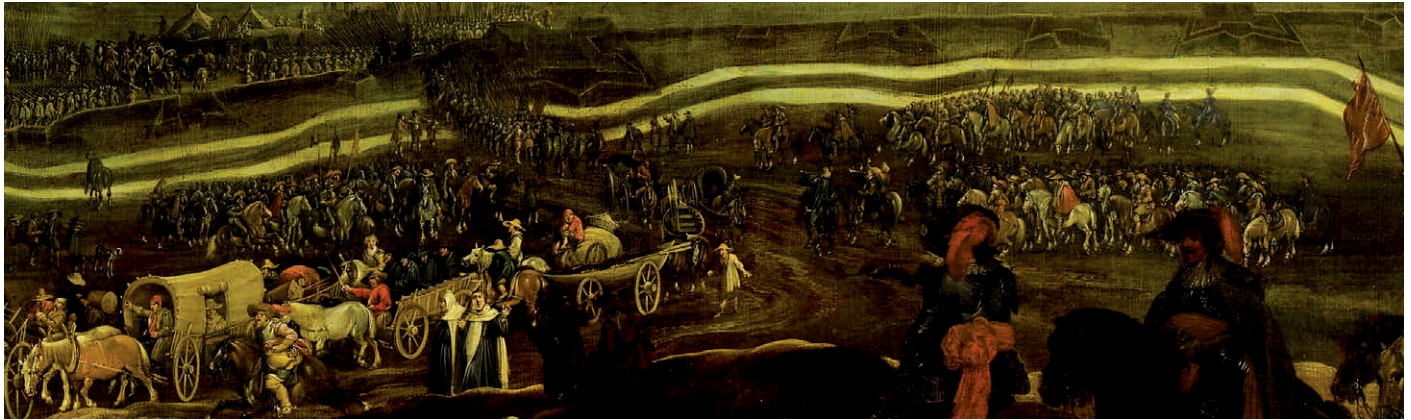
De Staten-Generaal en vorstelijke gasten uit heel Europa slaan op de Vughtse hei de uittocht van het Spaanse garnizoen gade (fragment van een schilderij van Pauwels van Hillegaert; Rijksmuseum, Amsterdam)

zaken. Elders verkochten de bakker, groenteboer en slager hun waren. Uithangborden bij tenten en huizen laten zien wat verhandeld werd. Soms moest iedereen zich even inhouden, namelijk als de prins met zijn gevolg Maurick verliet en door het dorp reed.