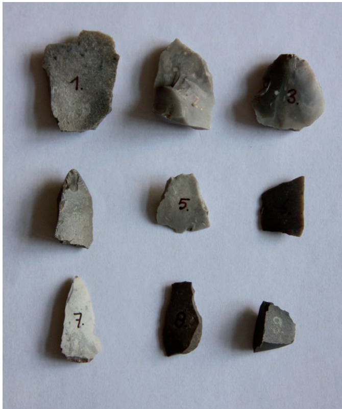
Vuurstenen gereedschappen uit het Mesolithicum, gevonden bij de Essche Baan. Nr. 1: schrabber en holschaaf; nrs. 2 en 8: steker; nrs. 3 en 9: schrabber; nr. 4: schrabber met steker; nrs. 5 en 6: transversale pijlpunt; en nr. 7: pijlpunt (Vughts Museum).

Meer dan een miljoen jaar geleden zorgden afzettingen van de rivieren Maas en Rijn voor de huidige ondergrond van Noord-Brabant. Daarna trokken talrijke kleinere riviertjes sporen door het landschap. Tijdens de tweede IJstijd (115.000 tot 9.700 voor Christus) werd Brabant bedekt met fijn zand, dat door de wind uit droge rivierdalen werd opgeblazen