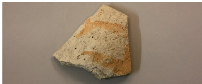
Pingsdorf aardewerk (Vughts Museum).