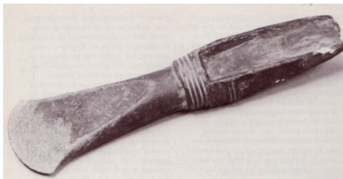
Bronzen bijl, gevonden bij de Dommel (Noordbrabants Museum, 's-Hertogenbosch).

Bronstijd (2.000 tot 800 voor Christus). Aannemelijk is dat toen in Vught en Cromvoirt gewoond werd op verspreid liggende boerderijen en dat landbouw en veeteelt belangrijke middelen van bestaan waren.