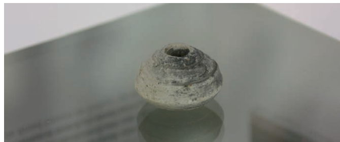
Spinsteentje (Vughts Museum).

De Vughtse Lunetten zijn uit militair-historisch oogpunt interessant, maar leveren weinig archeologisch materiaal op,