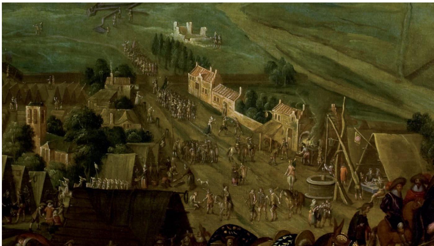
Vught in 1629. Links: de St.-Lambertuskerk; in het midden: de Taalstraat richting 's-Hertogenbosch; rechtsboven de ruïne van het Kartuizerklooster en rechts: de Dommel (toen Dieze). Schilderij van Pauwels van Hillegaert (1631), Van Lanschot Bank, 's-Hertogenbosch.

Het gebied van het oude Konzentrationslager Herzogenbusch bevat een bodemarchief dat nog nauwelijks is onderzocht. Toch mag worden aangenomen, dat gevangenen allerlei objecten hebben verborgen, of als overbodig hebben