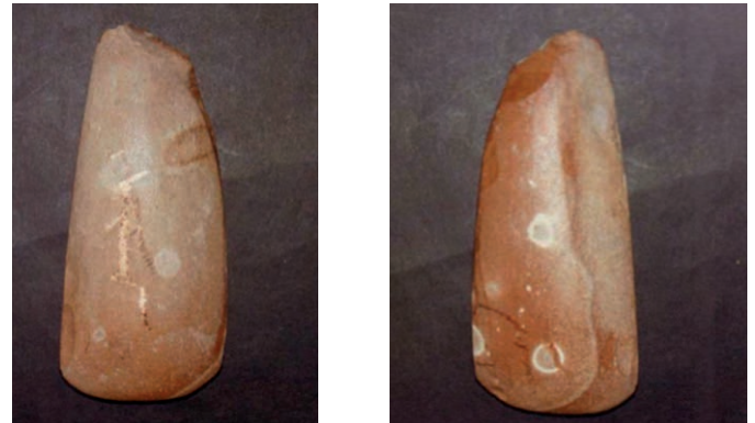
Stenen bijl, gevonden in de Gement.

Uit het Neolithicum (5.300 tot 2.000 voor Christus) stamt een stenen bijl die in de Gement werd gevonden. Het landschap