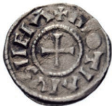
Eén van de valse 'guenars'; vindplaats: het Bossche Broek (Geld en Bankmuseum, Utrecht).

rest van de Taalstraat richting Den Bosch (met als bijzondere locatie het kartuizerklooster). Vanaf de Kleine Gent tot aan de N65 loopt óók nu nog een middeleeuwse dijk (Gentdijk) en een dode arm van de Dommel. Dit gebied werd vroeger Waterkant genoemd. Hier zijn een haventje en een veerpontje geweest. Buiten het kleine centrum kende Vught nog woonconcentraties zoals