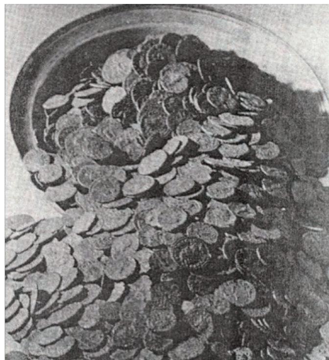
De 'Vughtse muntschat', Halder

De bebouwde kom van Vught bestond eeuwenlang uit het gebied van kasteel Maurick, het Maurickplein, de smalle Taalstraat, het begin van de tegenwoordige Helvoirtseweg met Zionsburg en de Lambertuskerk, de Dorpsstraat en het Marktveld. Verder was er nog lintbebouwing langs de