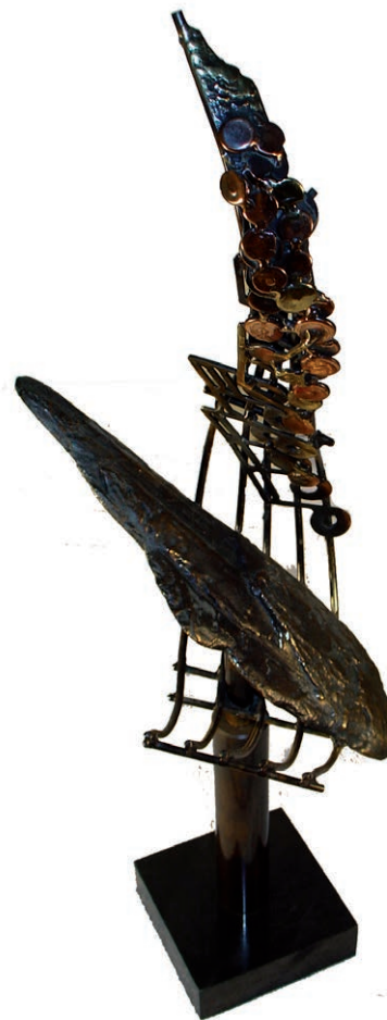
Ontwerp voor het monument 'Onthechting' ter herinnering aan de slachtoffers van de Herculesramp (gemeente Vught).