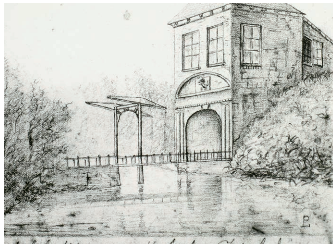
Poortgebouw van Fort Isbella.

De grote concentraties militairen, een tekort aan voedsel en de slechte hygiënische toestanden in de legerkampen zorgden voor het uitbreken van besmettelijke ziekten die de geschiedenis in zouden gaan als 'de pest'. Meer dan honger