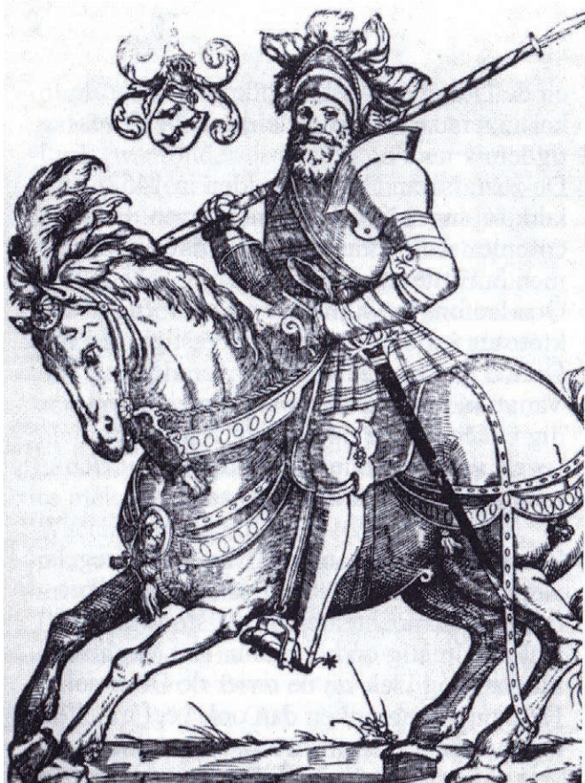
Maarten van Rossum, krijgsheer in dienst van de hertog van Gelre.

Maurits (1601 en 1603) en Frederik Hendrik (1629) had Vught flink te lijden. Niet alleen doordat het dorp gebruikt werd als legerplaats, maar óók doordat veel huizen werden gesloopt, bijvoorbeeld om een beter schootveld te krijgen. In 1629 verdwenen zo in Vught 150 boerderijen. In Cromvoirt bleef zelfs maar één huis overeind.