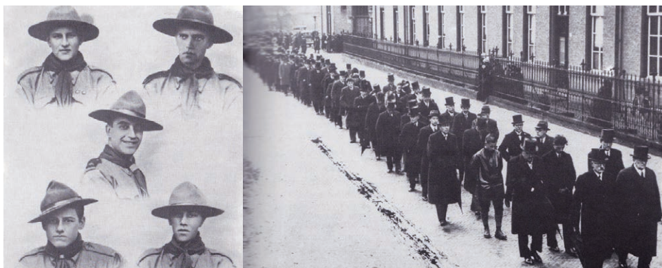
Foto van de vijf overleden verkenners en van de massale begrafenisstoet die door de Kloosterstraat trekt.

Eén van de opgesloten vrouwen was Tineke Wibaut: Toen het licht uitging barstte de paniek in volle hevigheid los. Het was een vreemd aanzwellend geluid, dat af en toe afebde en dan weer opnieuw aanzwol. Het werd voortgebracht door biddende, gillende en schreeuwende vrouwen. Sommigen probeerden er doorheen te roepen om de vrouwen tot kalme te manen en geen zuurstof te verspillen. Soms hielp dat, heel even, maar dan begon het weer. Het hield niet op, die hele nacht niet, het werd alleen minder geluid. De hitte werd verstikkend. Na veertien uur opsluiting bleken tien vrouwen gestikt en moesten de overigen onder medische behandeling worden gesteld. Omdat de SS het Vughtse Kamp graag als een modelkamp wilde presenteren, werden commandant Grünewald en zijn adjudant uit hun functies gezet en veroordeeld tot gevangenisstraf. Door tussenkomst van Himmler werd die straf omgezet in frontdienst in Oost-Europa. Grünewald sneuvelde in 1945 in Hongarije als gewoon soldaat.