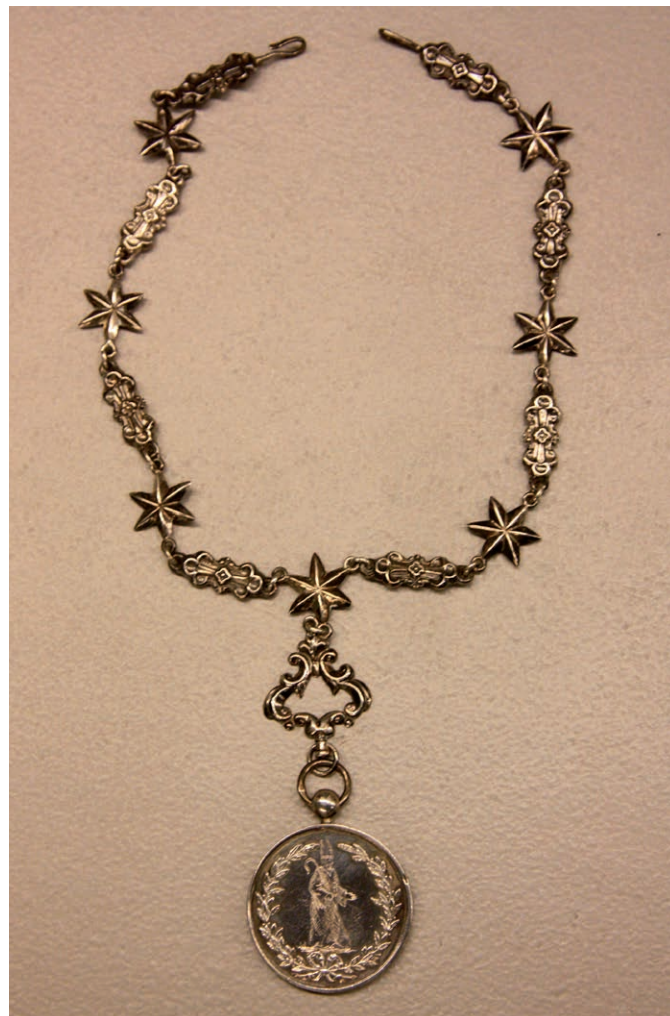
De ambtsketen van de burgemeester van Cromvoirt (Vughts Museum).