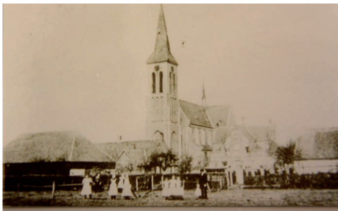
De St.-Lambertuskerk in Cromvoirt.