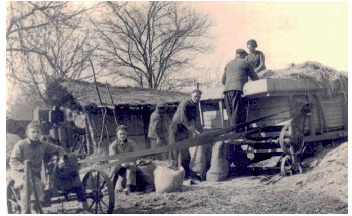
Aan de slag met de dorsmachine.